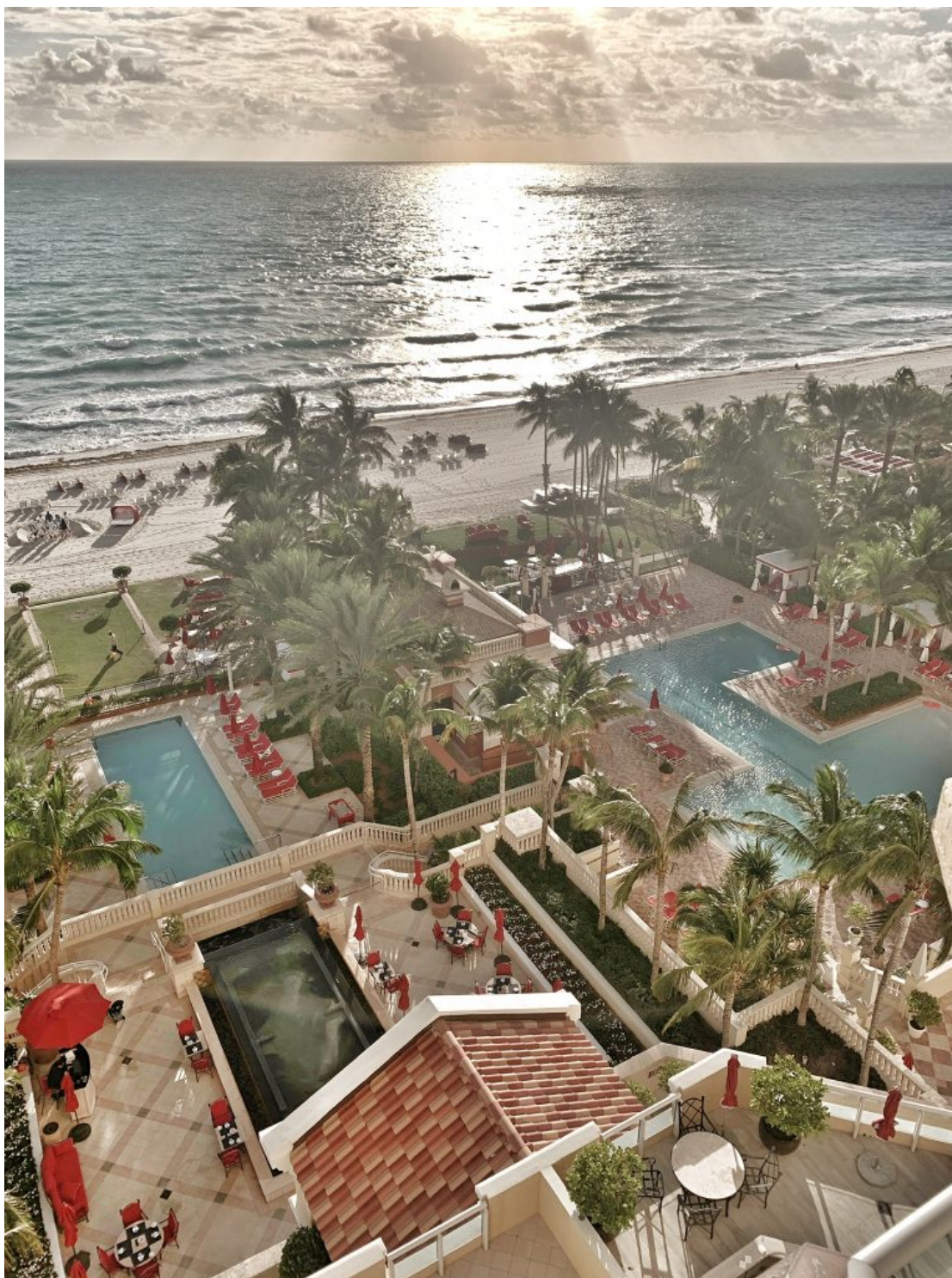
Todos os quartos têm vista para o mar.

Apesar da pompa do arranha-céu de estilo mediterrâneo, tomado de Rolls-Royce em frente à entrada principal, o ambiente interno é sempre relax – afinal, seus hóspedes estão, em sua maioria, simplesmente desfrutando férias à beira-mar. O check in é sempre feito com o hóspede tomando seu champagne ou bellini geladinho, em um clima descontraído, quase informal, sem qualquer tipo de afetação – e rapidinho. Ali, funcionários chamam a gente o tempo todo pelo nome, do concierge aos garçons, criando laços naturais de intimidade –