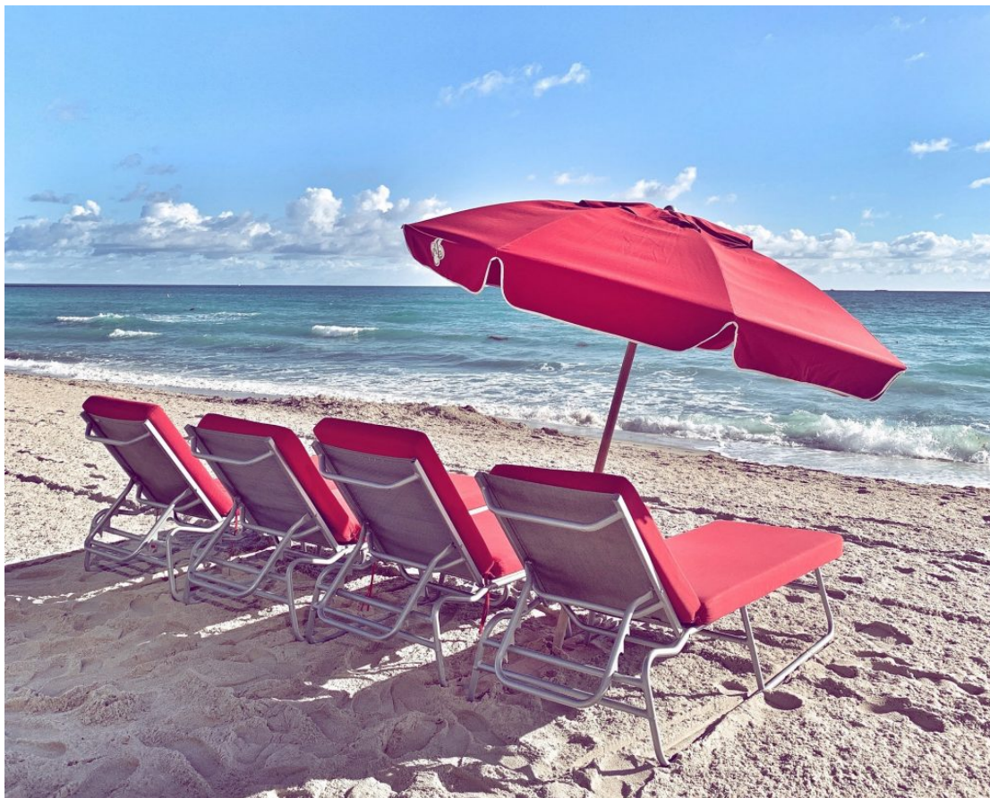
Serviço de praia super caprichado incluído nas diárias.

Para quem não tem planos de se hospedar lá por enquanto, recomendo muito o brunch dominical, já que os restaurantes e o bar estão sempre abertos também para não-hóspedes. Por 85 dólares você tem direito a um amplo buffet de frutos do mar, saladas, pratos quentes, massas feitas na hora, itens de café da manhã e sobremesas, além de prosecco, bellinis e bloody marys à vontade – tudo de frente para o mar, com a excelência de serviços do hotel.